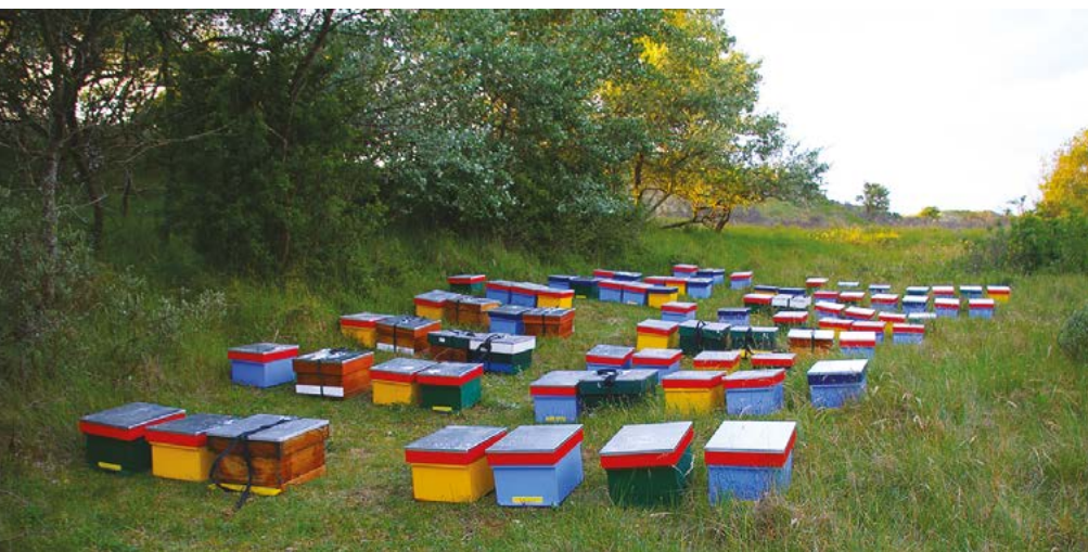
Colonies dans la réserve naturelle à Amsterdam

3. Université de Wageningen, Wageningen, Pays-Bas